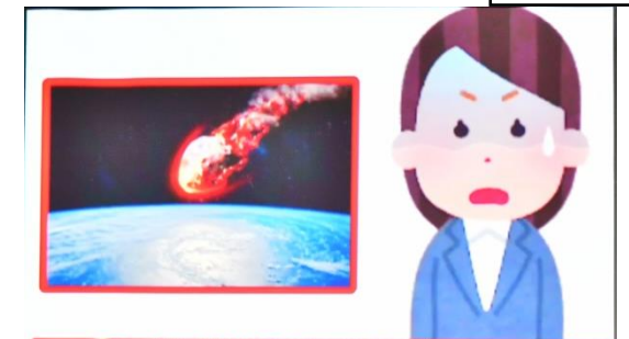
速報 隕石が突撃するまであと1分 地球滅亡!?